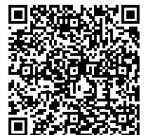
Verarbeitungs- anleitung STEICO Unterdeck- platten